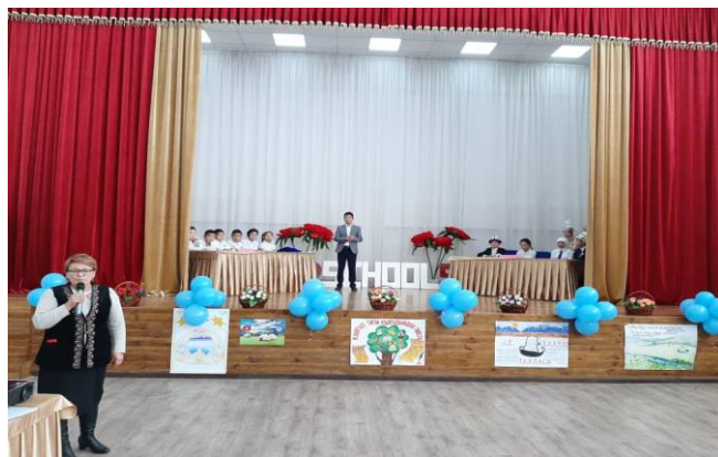
Ачык сабактар өз учурунда интерактивдүү ыкмалар менен өткөрүлдү.